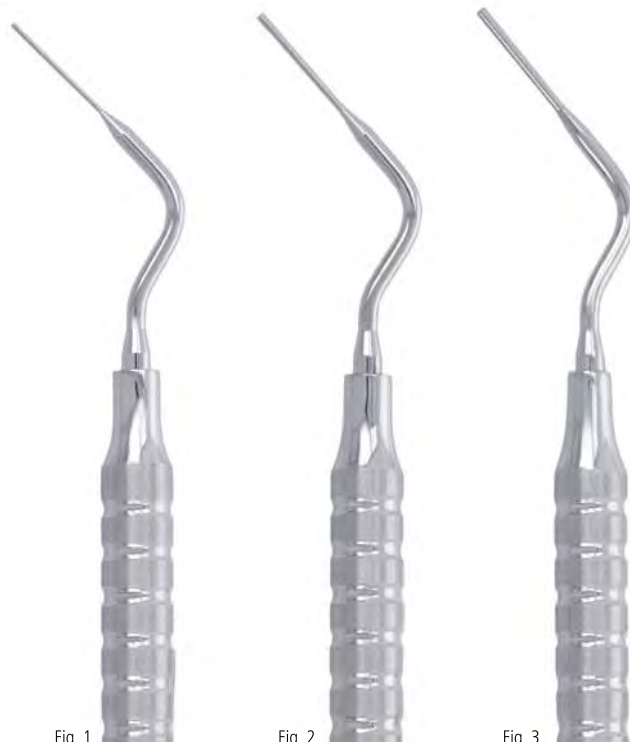
Fig. 1 ORI-J137 ORI-KE-710-137